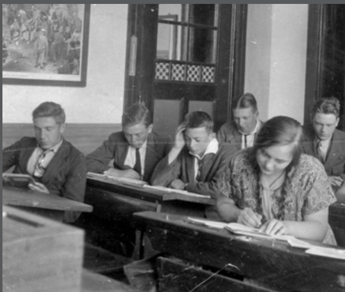
MULO leerlingen geconcentreerd aan het werk in het gebouw aan de Heemker Akkerstraat

En wij, de leraren? Wij misten in de pauze ons hoekje onder de trap in de hal waar we koffie dronken, praatten en de hele boel in de gaten konden