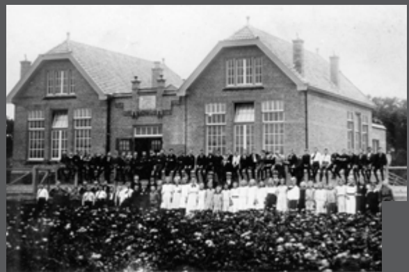
Het personeel en alle leerlingen van de M.U.L.O. in 1923.