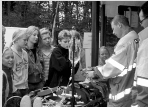
"Leerlingen van de RSG in actie tijdens verschillende evenementen"