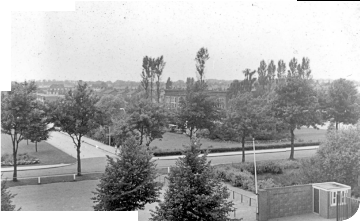
Uitzicht vanuit het tekenlokaal in noordwestelijke richting. Het B-gebouw omgeven door populieren en rechts op de voorgrond de ingang van het Dr Mansholt-sportpark.