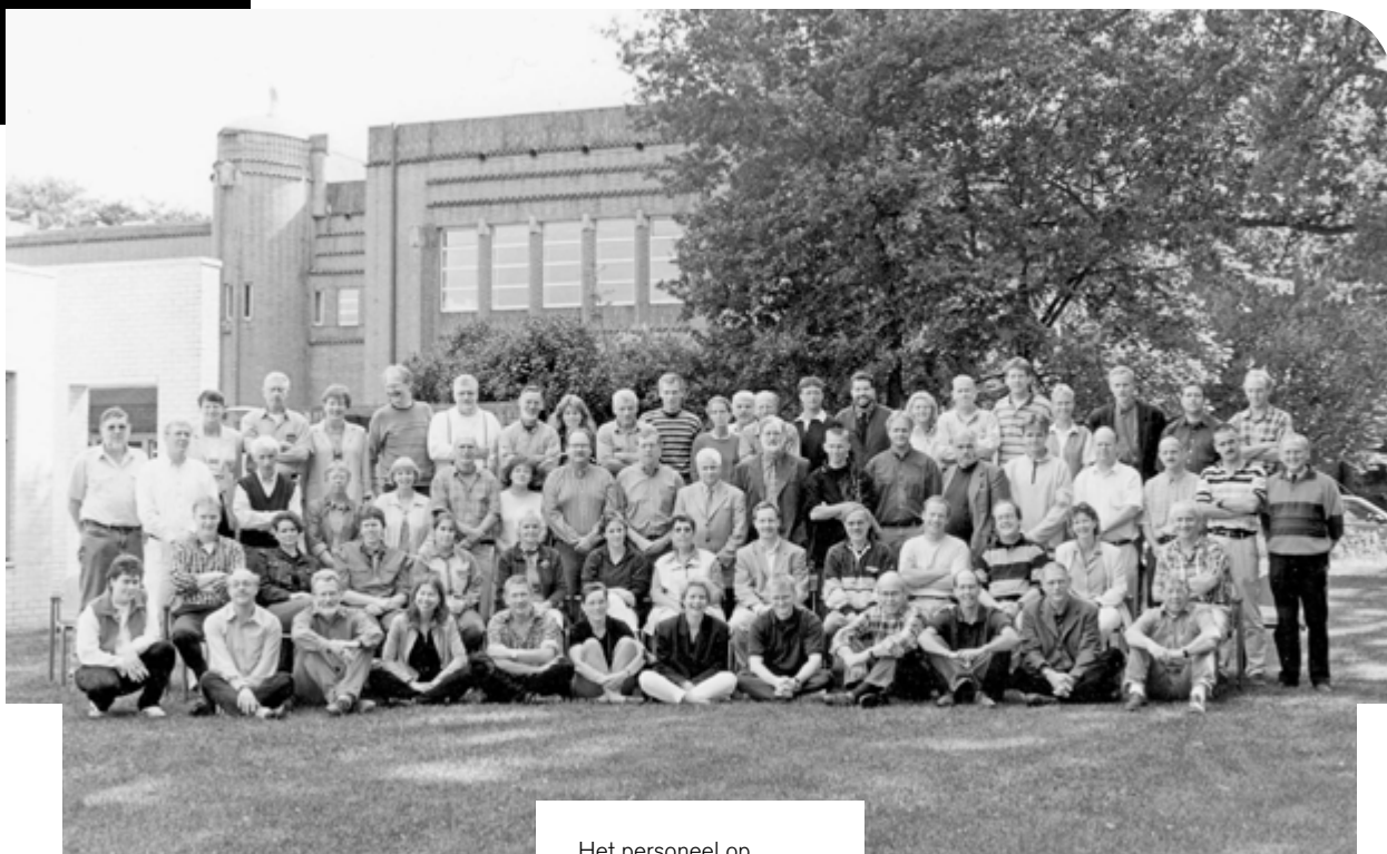
Het personeel op portret achter de school in 1998.