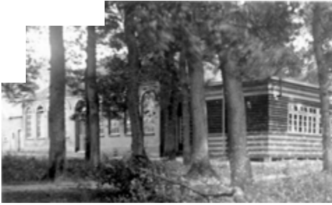
Het "houten gebouw" dat in 1922 tegen de oude Kloosterschool wordt geplaatst om het ruimtegebrek op te lossen.