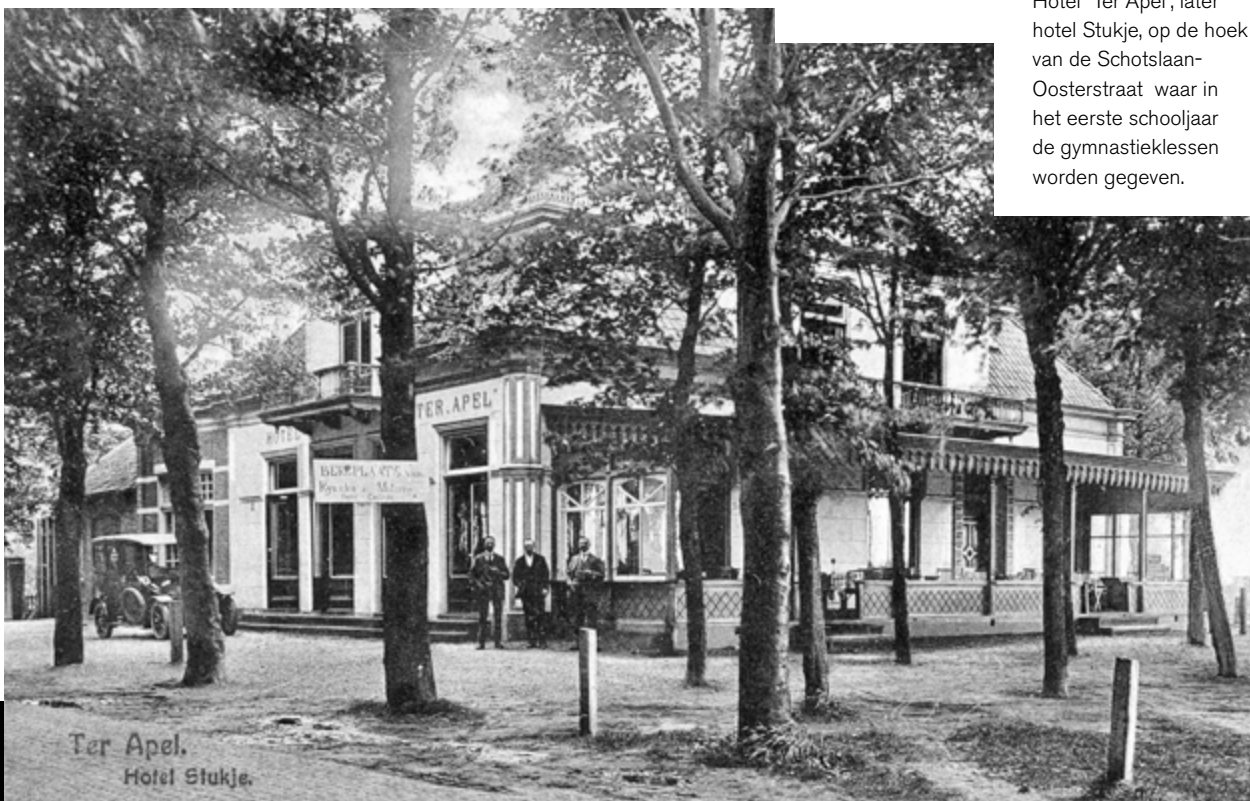
Hotel "Ter Apel", later hotel Stukje, op de hoek van de Schotslaan-Oosterstraat waar in het eerste schooljaar de gymnastieklessen worden gegeven.