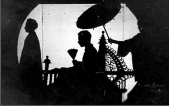
Sfeervol schaduwspel uit een van de schoolavonden in het Boschhuis

Op de H.B.S. kwamen de leerlingen uit een veel groter gebied. Vele leerlingen moesten alle dagen noodgedwongen grote afstanden door weer en wind op de fiets afleggen.