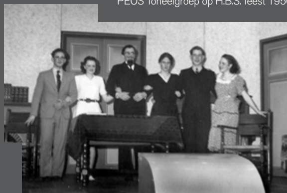
PEOS Toneelgroep op H.B.S. feest 1950