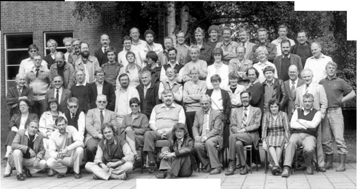
Het RSG personeel in 1983-84

Vele vergaderingen en besprekingen en het antwoord op de vraag is nog nauwelijks te geven.