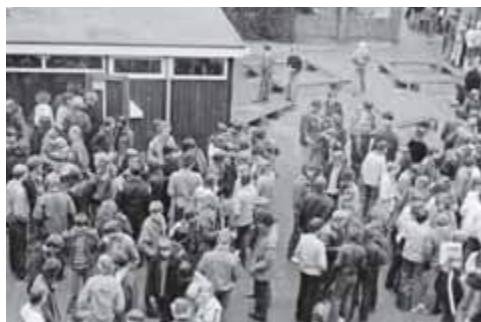
Het plein achter het A-gebouw midden jaren '70, links de kantine.

Voor de Rijksscholengemeenschap Ter Apel betekent de fusie feitelijk vooral een nieuw begin. De school kent een idealistisch streven om van de Mammoetwet iets goeds te maken. Men is begonnen de naam 'behoudend en elitair' van zich af te schudden. Onderwijsontwikkelingen worden al zoekende ingezet, zoals