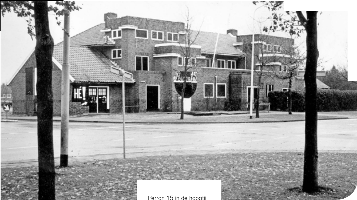
Perron 15 in de hoogtij- dagen rond 1978 in het oude stationsgebouw.

kum. Dit, tot verdriet van velen (die Bodewitz uiteraard deze promotie ook gunnen). Het vertrek van Bodewitz wordt als volgt vermeld in 'De Oude Weg' van juni 1975: