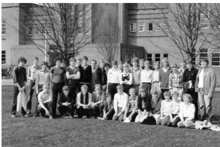
Klassenfoto VWO6 uit 1980 met drie redactieleden

Die tevredenheid overheerst overigens niet in alle jaren. Het schooljaar 73 – 74 kent tegenvallende eindexamenresultaten. In een overzicht: