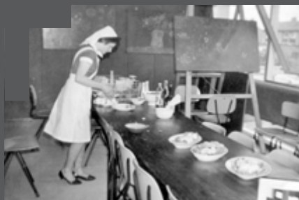
Onderwijsactiviteiten in "de Korenschoof"

Dus werd er veel geschreven en gebeld tussen de scholen die meededen in Ter Apel. Wie waren de deelnemers aan deze Tienkamp zoals die in de krant