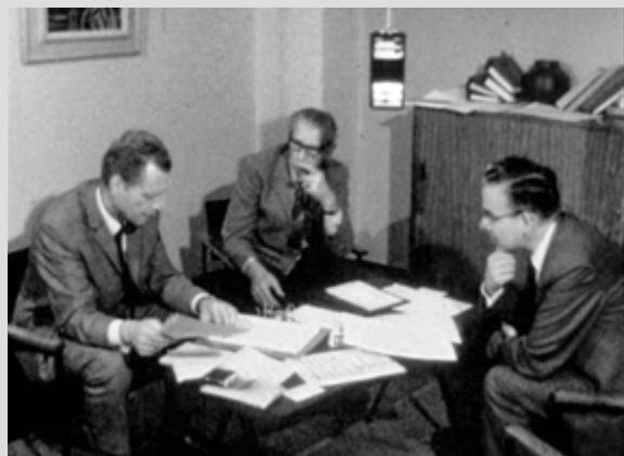
Filmstills uit de film 'Zomaar een schooldag 1971' (als bijlage bij dit boek).