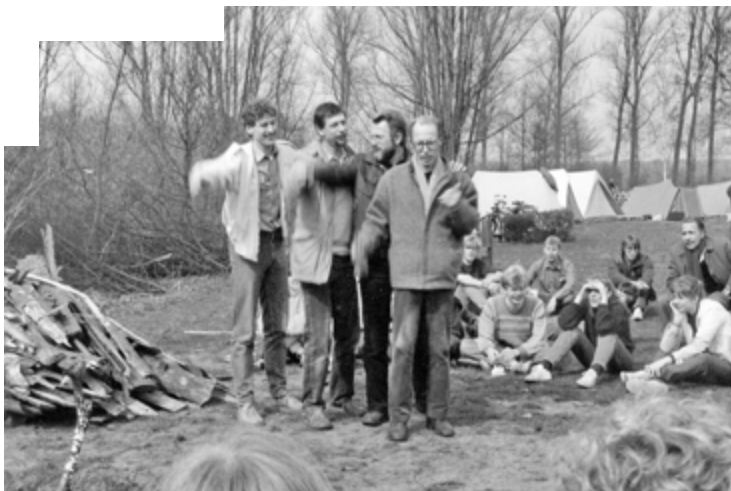
Tijdens een van de vele stunts, hier in 1984 op de latere begraafplaats aan de Poortweg waar de leerlingen kampeerden en leraren werden onderworpen aan survival oefeningen.