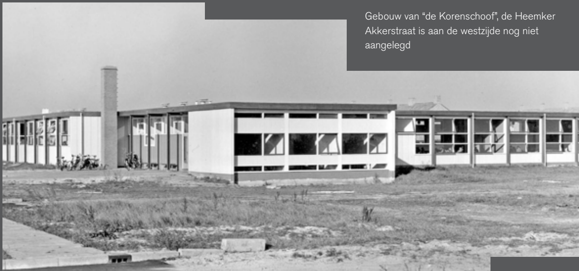
Gebouw van "de Korenschoof", de Heemker Akkerstraat is aan de westzijde nog niet aangelegd

hoorde ook de voorloper van 'De Korenschoof' in Ter Apel. De landbouwhuishoudschool in Ter Apel heeft niet lang de naam 'De Korenschoof' gehad. In het begin wordt er gewoon geschreven over de LHNO-school, de school voor het Lagere Huishoud- en Nijverheidsonderwijs. Dat begin is niet eenvoudig aan te wijzen. Dat heeft te maken met de afwijkende constructie van het landbouwonderwijs. Dit type onderwijs valt nog altijd onder het gezag van het ministerie van landbouw ( en nu ook economie en innovatie). Als dus gezocht moet worden naar archiefmateriaal over de