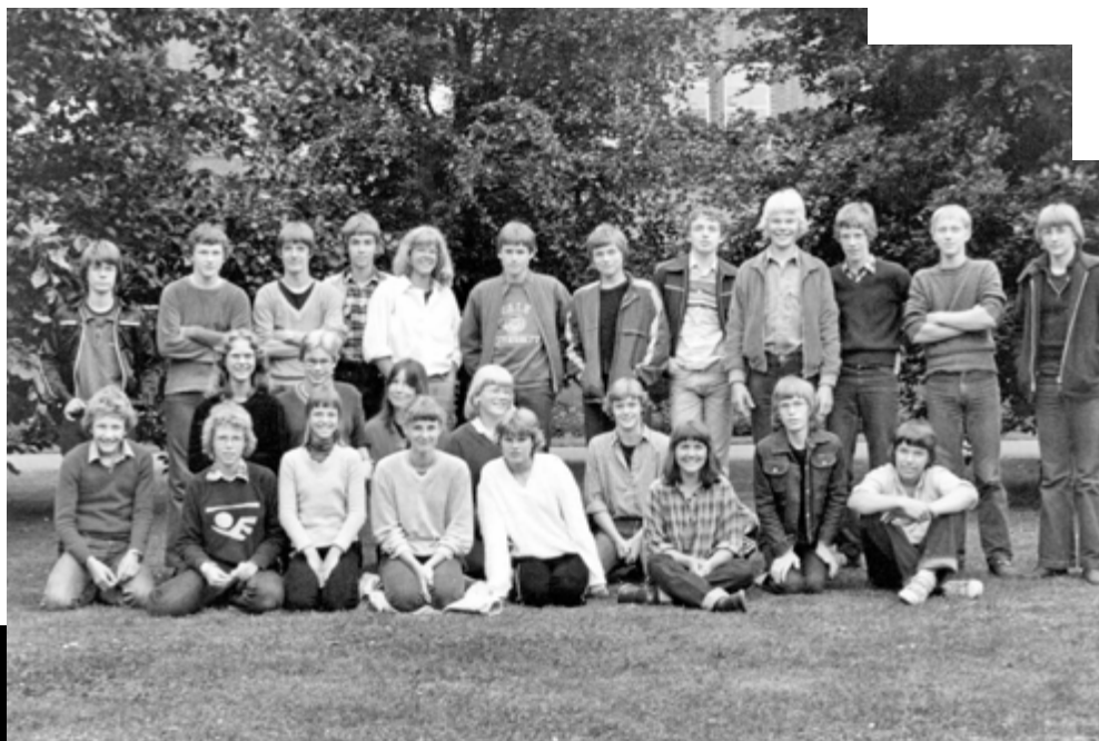
Schoolklas rond 1980