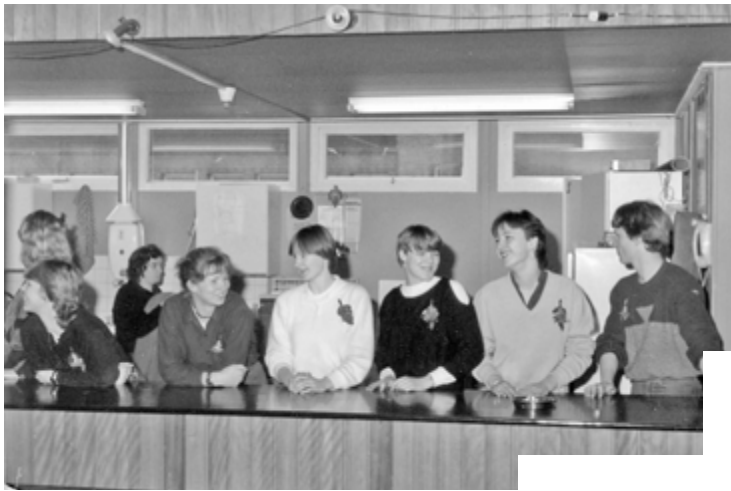
Eindexamenkandidaten 1984 tijdens een feest achter het buffet van de kantine. De schrootjeswand was helemaal van die tijd.