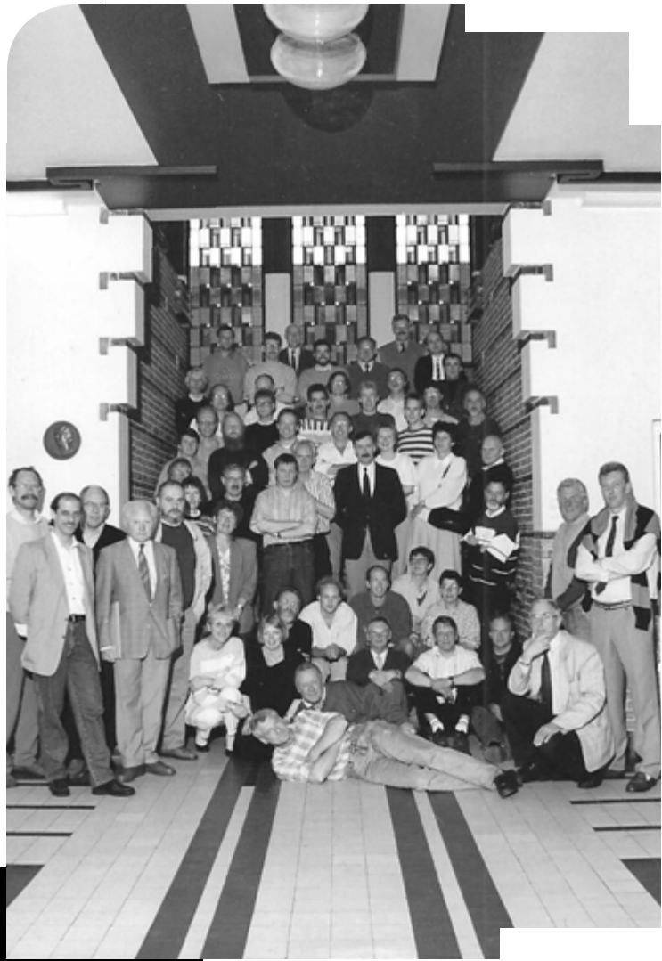
Personeel ten tijde van Sakkers op het mooiste plekje van de school.