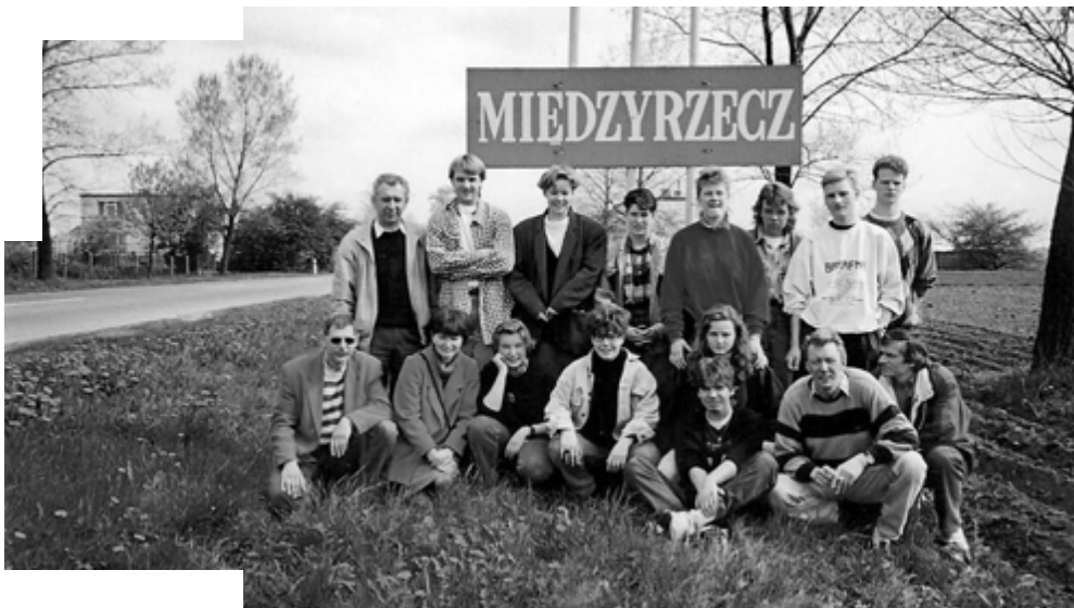
Leerlingen tijdens de uitwisseling met de partnergemeente in Polen (1992)