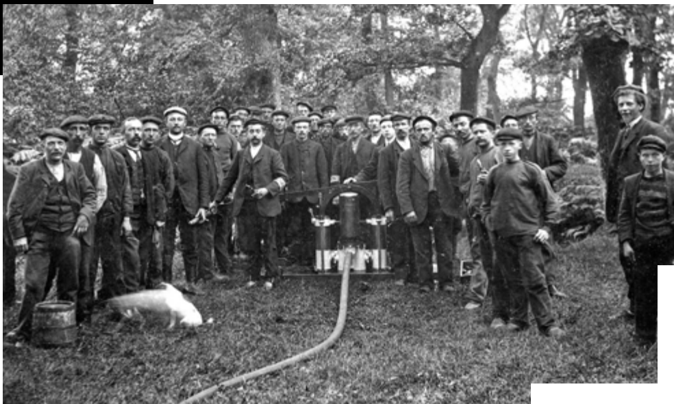
Ingebruikname van de nieuwe brandspuit van Ter Apel. Opname van omstreeks 1916, waarschijnlijk in de buurt van het Klooster.

De bezorgdheid drong door tot het toenmalige college van burgemeester en wethouders. Het leerlingenaantal werd dusdanig laag dat opheffing van de school dreigde. Om een lang verhaal kort te maken, kan vastgesteld worden dat de gemeente Vlagtwedde eind jaren veertig van de vorige eeuw tot het inzicht kwam dat de vestiging van een jongensinternaat in Ter Apel een goede zaak zou zijn.