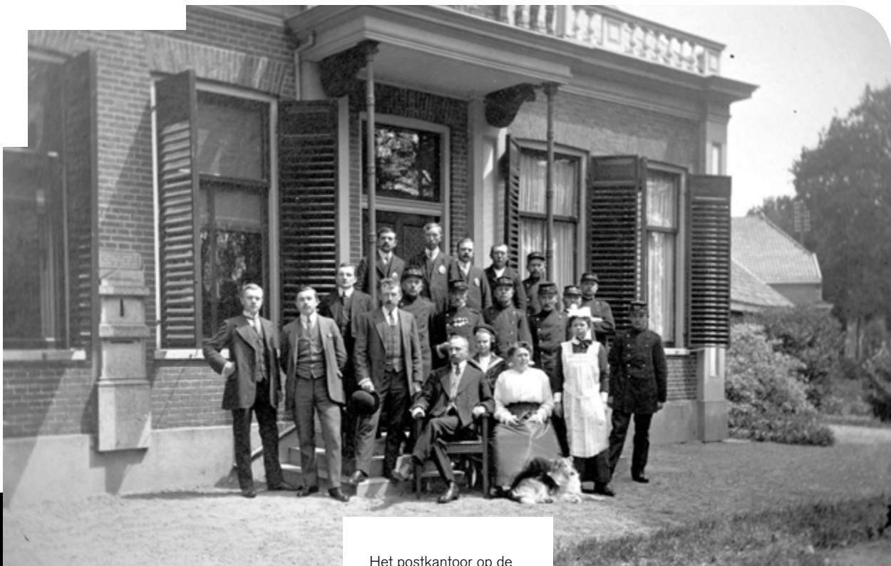
Het postkantoor op de hoek van de Hoofdstraat en de Viaductstraat omstreeks 1916. Het aantal ambtenaren weerspiegelt de opkomst van Ter Apel als streekcentrum.

werking is met de klok nog steeds te bewonderen. Gestadig aan tikt de tijd nog steeds voort, afgewisseld met Big Ben-slagen.